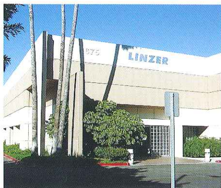
Linzer Products Corp.