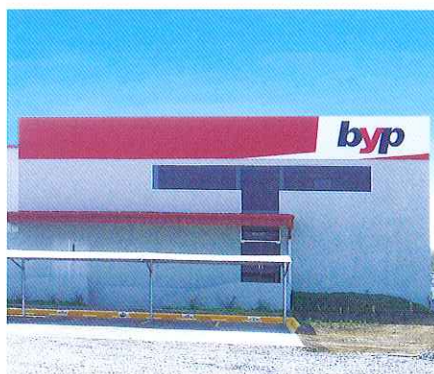
Brochas y Productos SRL