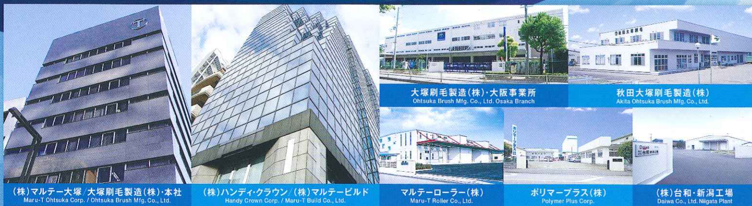
(株)マルテ大塚 大塚刷毛製造(株)本社 Maru-T Ohtsuka Corp. / Ohtsuka Brush Mfg. Co., Ltd.

東京都台東区上野5-6-10 5-6-10 Ueno, Taito-ku, Tokyo プラスチックに関する一連製品の製造及び販売 Manufacturing and sales of plastic products.