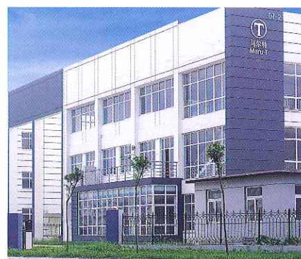
馬爾特塗裝工具(天津)有限公司 Maru-t Roller (Tianjin) Co.,Ltd.